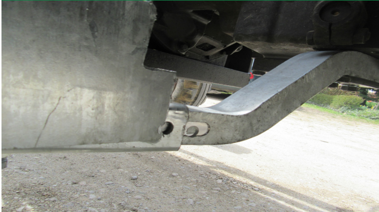
Auftritt wird mit Schraube 10x70 am Tritthalter be- festigt