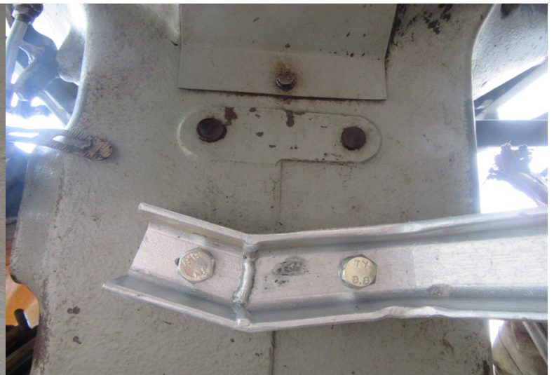
Tritthalter wird mit 2 Schrauben 12 x 25 mit Sprengling am Getriebelock verschraubt