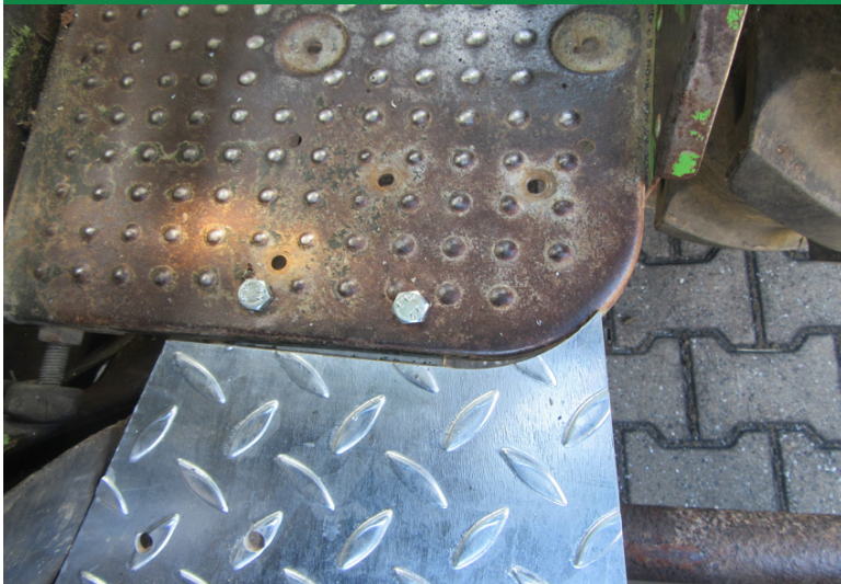
Schutzblech wird mit 2 Schrauben 8 x 30 mit dem Trittbrett verschr., 2 Bohrungen am Trittbrett anbringen