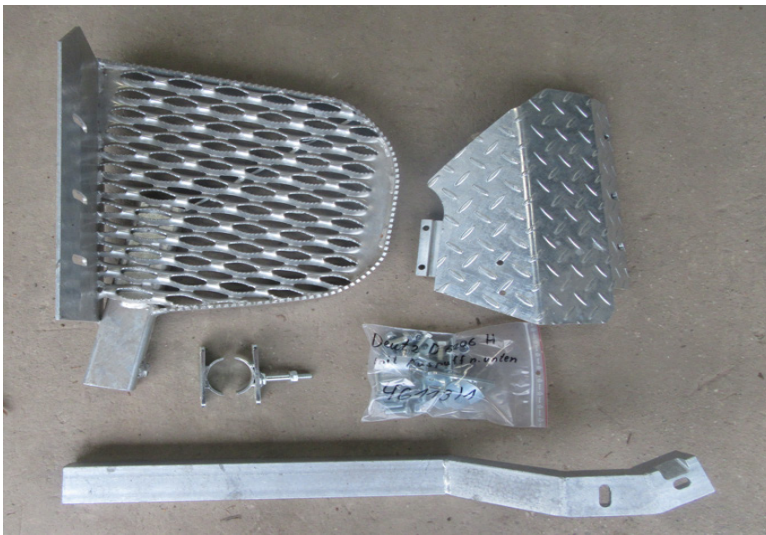
Lieferumfang: Tritthalter, Auftritt, Schutzblech, Auspuffschelle, Schraubensatz