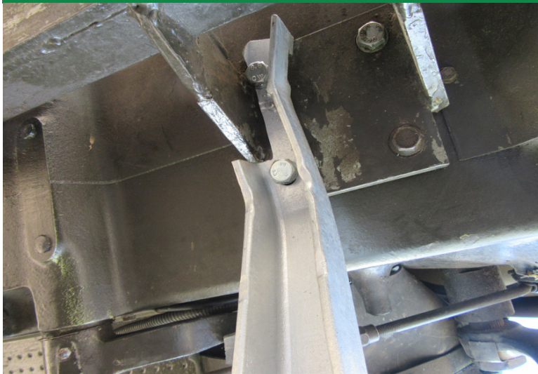
Bei Busatismäherwerk muss der Tritthalter der Mähwerksbefestigung angepasst werden