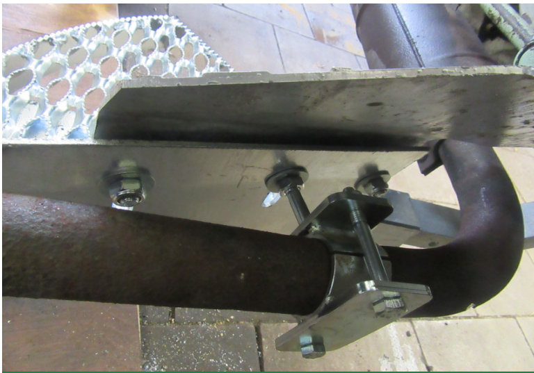
Auspuffrohr mit Schelle am Auftritt verschraubt