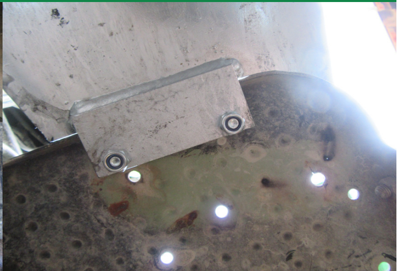
Schutzblech und Trittbrett von unten