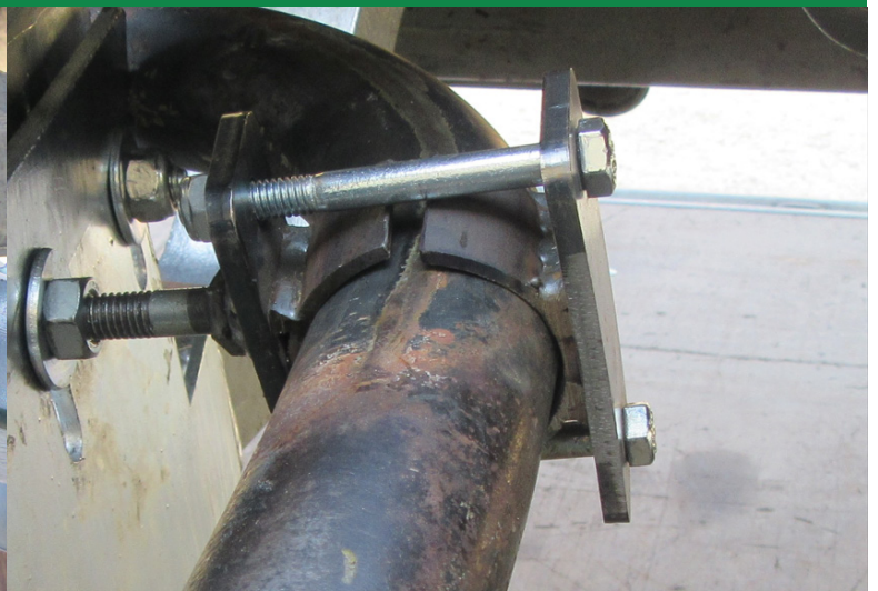
Auspuffschelle wird mit 2 Schrauben 8 x 80 am Auspuffrohr befestigt und mit dem Auftritt verschraubt