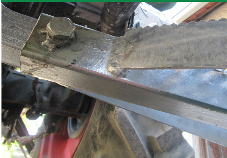
Auftritt wird mit Schraube 12 x 25 oder 12 x 55 am Tritthalter gesichert