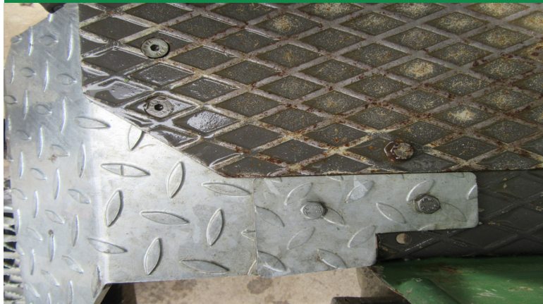
Schutzblech wird mit 2 bzw. 4 Schrauben 8x20 am Trittbrett angeschraubt