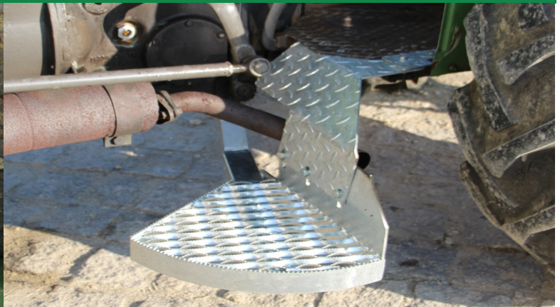
Auftritt - komplett - montiert