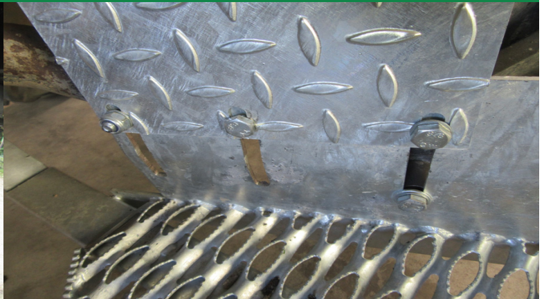
Schutzblech wird mit 2 Schrauben 10x25 befestigt