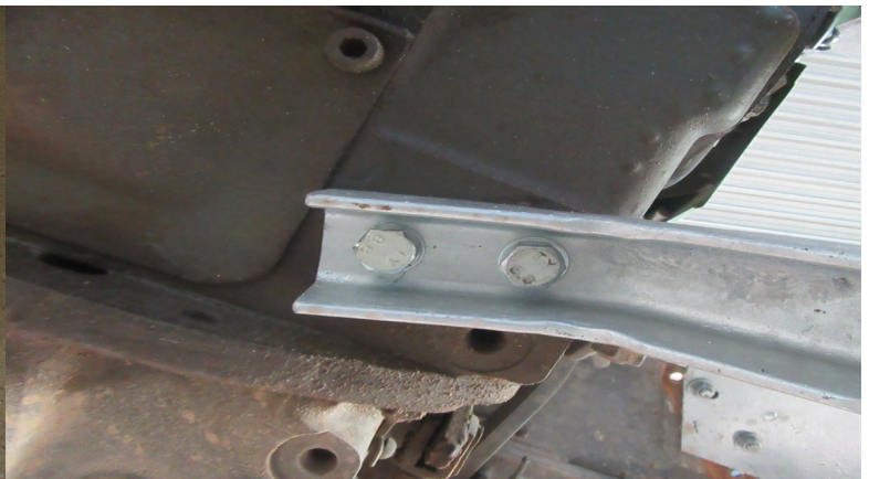
Tritthalter wird mit 2 Schrauben 12x25 mit Spreng- ring am Getriebekblock befestigt