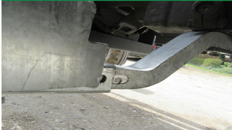
Auftritt wird mit Schraube 10x70 am Tritthalter be- festigt